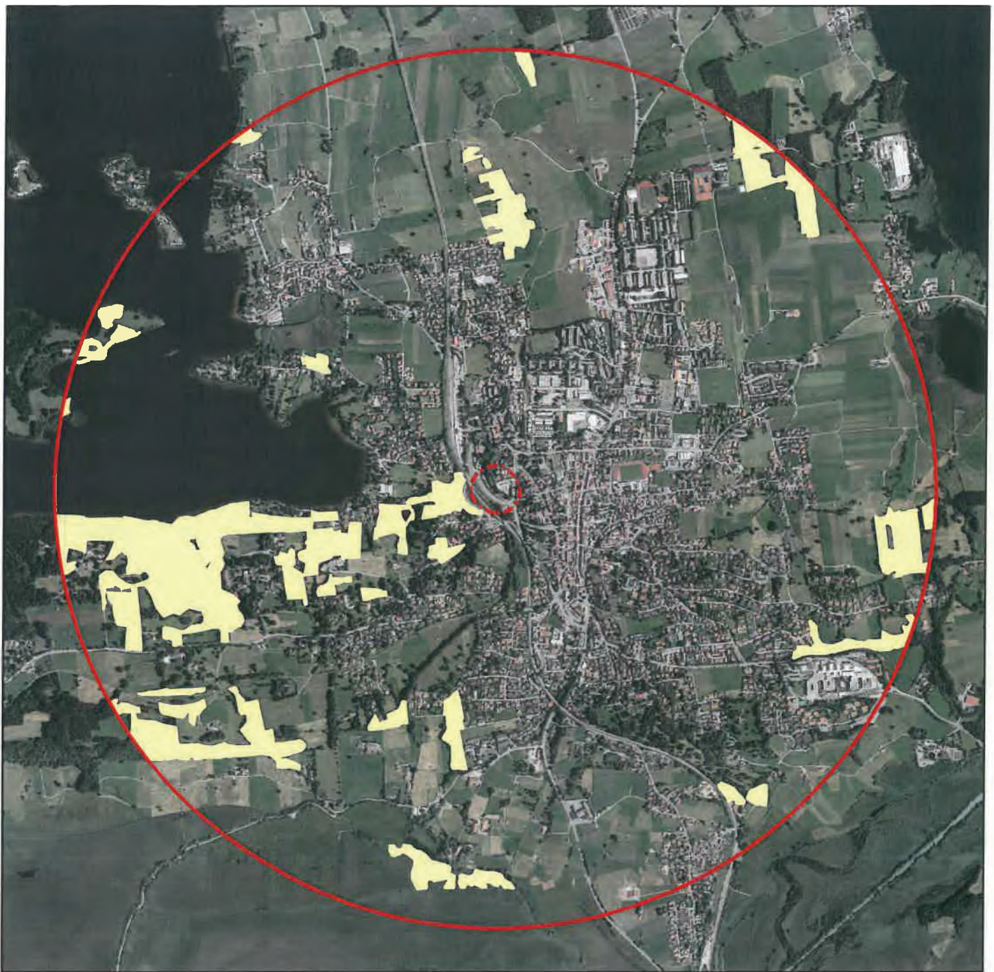
Plan des abgegrenzten Gebietes (Quarantänezone), bestehend aus einer Pufferzone und einer Befallszone, festgesetzt mit der Allgemeinverfügung der Bayerischen Landesanstalt für Landwirtschaft über Maßnahmen zur Bekämpfung des Asiatischen Laubholzbockkäfers vom 03.02.2017